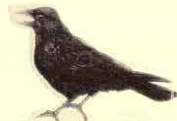
la corneille noire

NOUVEAU : ne pas oublier de retourner les carnets d'inscription et de renouveler la déclaration de piégeage fin juin pour la nouvelle année cynégétique